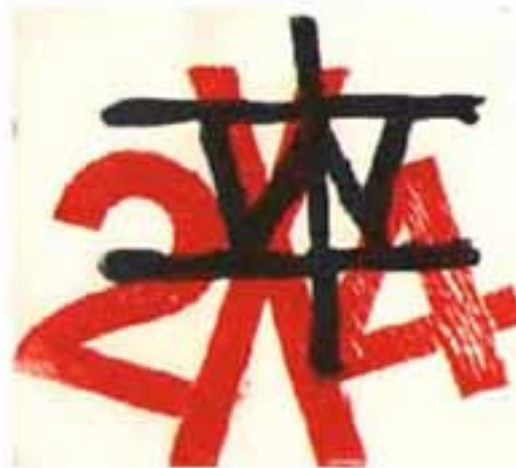
Poema Visual (xilografía)

A nivel teórico se destaca su propuesta "Hacia una Poesía para y/o a Realizar", a través de la cual intenta llevar, al espectador, de su rol pasivo a la categoría de constructor-creador del poema. Su obra clásica en este sentido es "De la Poesía Proceso a la Poesía para y/o a Realizar" (Diagonal Cero, La Plata, 1970). Y continuó con la "I Expo de Proposiciones a Realizar" de 1971, que realizó en el Cayc de Buenos Aires donde, con el marco de las propuestas recibidas de casi todo el mundo, se reunieron los artistas Wladimir Dias-Pino (creador del Poema/Proceso brasileño), Guillermo Deisler, poeta visual chileno, hoy extinto, y los uruguayos Francisco Accame, músico y poeta fónico y Clemente Padín.