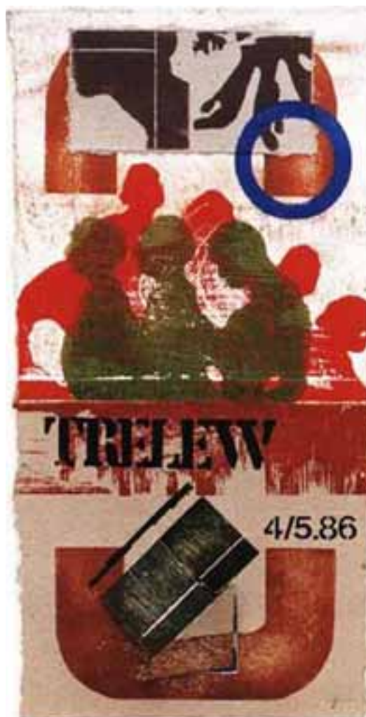
Trelew, 1986, (xilografía)

"Hacia un arte tocable que quiebre en el artista la posibilidad del uso de materiales "pulidos" al extremo de que produzcan el alejamiento de la mano del observador -simple forma de atrapar- que quedará en esa posi-