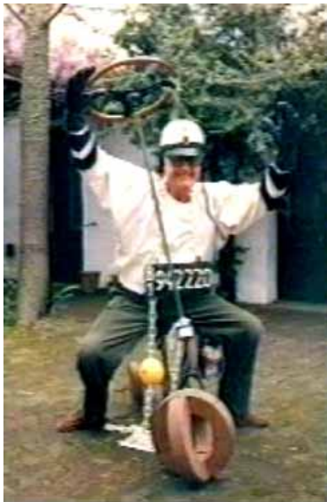
Máquina Inútil, 1965

ción sin participar "epidérmicamente" de la cosa. Vía uso de materiales "innobles" y para un contexto cotidiano delimitador del contenido.