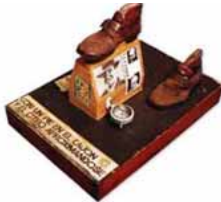
Con un pie en el cajón y el otro aproximándose..., 1995

Para terminar, permítanme citarme: "Difícilmente esta breve nota, sin ninguna pretensión crítica, pudiera abarcar todas o algunas de las facetas y dimensiones de este creador infatigable, apenas rescatar esquemáticamente su actitud frente al arte y a la sociedad en la que vivió y sufrió, de quien sólo pudo sujetarse a sus propias reglas y que, trató, durante toda su vida a ser consecuente con sus ideas libertarias. Su obra perdurará eternamente en tanto exista en el hombre ese afán por la libertad que él intentó mantener despierto enfrentándonos a la disyuntiva de elegir entre las variadas posibilidades de significación (incluso de alterar el sentido) que ofrecían sus obras y asumir y concretar así, a través de la opción, nuestra más genuina naturaleza : la aspiración a la libertad."