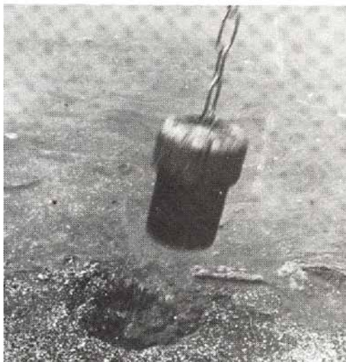
El Tapón del Río de la Plata, 1973

En 1969 realiza su film "Blanco sobre Blanco: Homenaje a Kasimir Malevich" -que debía proyectarse de manera tal que la imagen quedara a espaldas del público. En ese mismo año, organiza la "Exposición Internacional de Novísima Poesía" en el Instituto Di Tella de Buenos Aires.