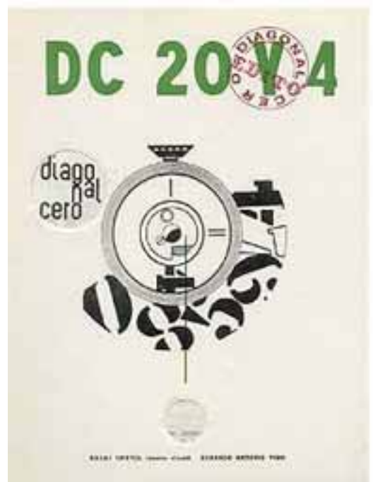
El Ciclista Oprimido, 1975

En 1965, el público de La Plata volverá a recibir con indignación otro de sus trabajos, el "Palanganómetro Mecedor para Críticos de Arte", presentado junto a la "Bi-Tri-Cicleta Ingenua" en el Museo de Artes Plásticas de La Plata, en el contexto de la exposición de artistas reunidos en torno al Movimiento de Arte Nuevo. Vigo será despectivamente motejado de "vanguardista". Tal vez empujado por esa incompreensión violenta de la que su propia ciudad lo hacía objeto, Vigo sólo volverá a exponer en muy contadas ocasiones y en espacios alejados del circuito institucional, desarrollando sin embargo una actividad continua en el área alternativa.