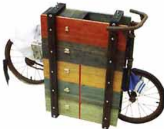
El Ciclista Oprimido, 1975

“Consistió en analizar desde el punto de vista estético y creativo el semáforo ubicado en las intersecciones de las avenidas 1 y 60, de La Plata. Tratándose de un elemento anónimo e inútil para su función específica (causante esto último de irónicos comentarios ciudadanos) ese manojo de semáforos, motivó el intento de implementar un diálogo de base concreta y contenido abstracto. El público invitado a concurrir, debió desarrollar sus ideas utilizando las claves mínimas dadas por el convocante, que no concurrió a la cita. El propósito era restar todo contacto prejuicioso para generar una acción en libertad.”