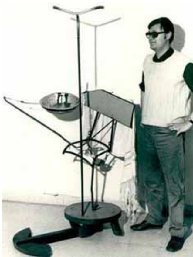
Palanganómetro Meceador para Críticos de Arte, 1965